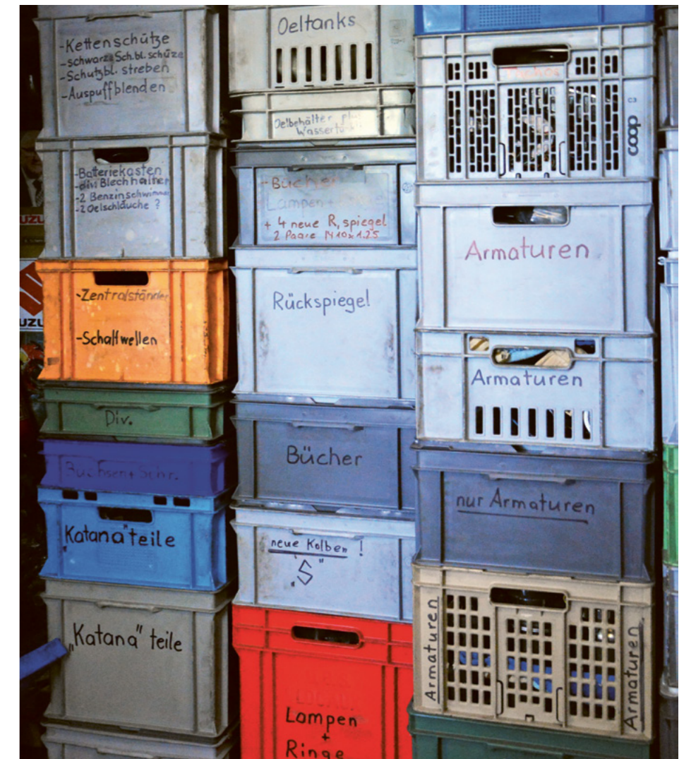
Unzählige Teile werden in einer Vielzahl von Plastikboxen gelagert.