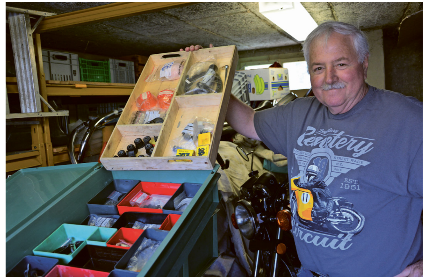
«Suzuki-Kari» mit sauber geordneten Kleinteilen.