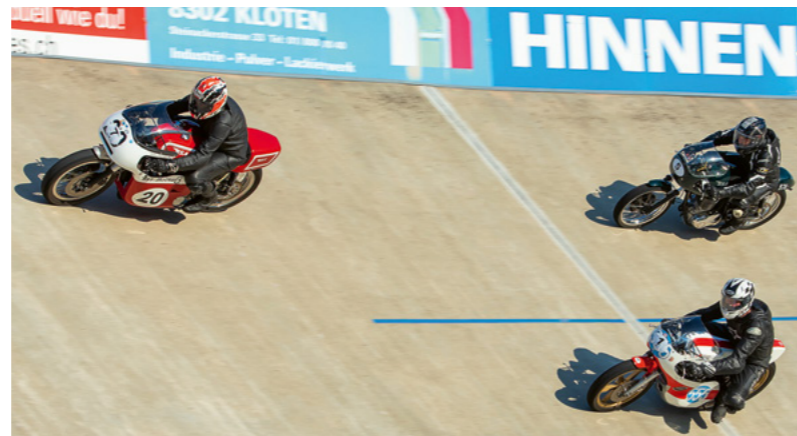
Zum 17. Mal dröhnten die Oldies bei brütender Hitze durch die Steilwand der Radrennbahn Oerlikon.