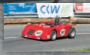
Der dänische Corami besitzt einen Fiat-128-Motor. Auffallend ist der extrem kurze Radstand.