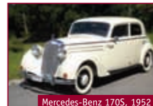
Mercedes-Benz 170S, 1952

9430 St. Margrethen - 071 4500 111 - www.goodtimer.ch