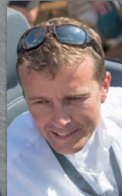
Ehrengast in Altbüron war der zweimalige Le-Mans-Sieger und Langstreckenweltmeister von 2012, Marcel Fässler.