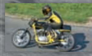
Auf Basis einer ehemaligen 350er-Condor-Armeemaschine aufgebaute «Swiss Army Racer».