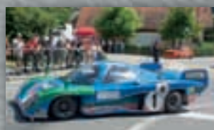
Der Inaltera Ford-Cosworth fuhr 1976 bis 1978 in Le Mans.