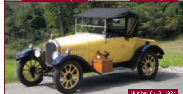
Humber 8/18, 1924