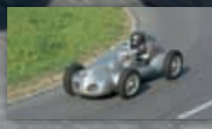
Rennwagen mit Motorradmotor: Der Kondor-BMW wird von einem 500 ccm BMW Boxermotor angetrieben.