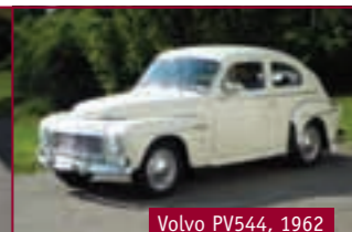
Volvo PV544, 1962